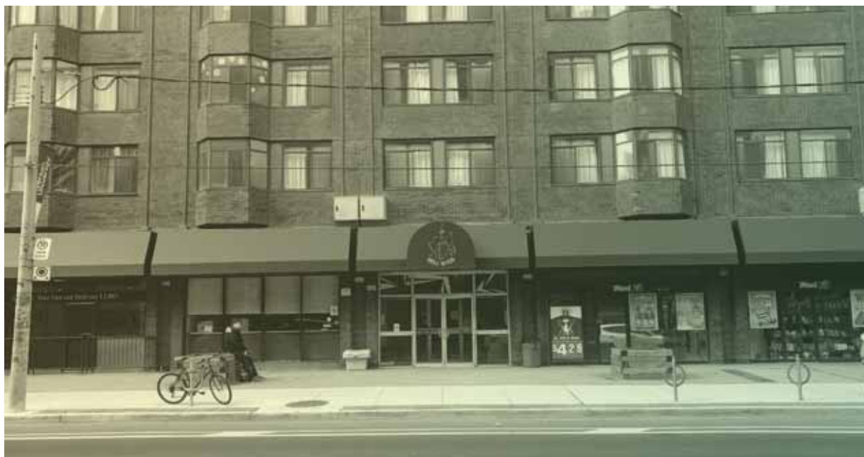
Façade de la coopérative Neill-Wycik, construite en 1970

L'UTILE maintient une veille stratégique des meilleures pratiques de son domaine dans le monde à travers notamment le programme de Séjours d'intégration des meilleures pratiques en logement étudiant (SIMPLE) . En 2017, deux coopératives d'habitation étudiantes ont été visitées à Toronto pour comprendre leur réalité, dont Neill-Wycik, une coopérative avec 700 membres répartis sur 22 étages située au centre de la ville.