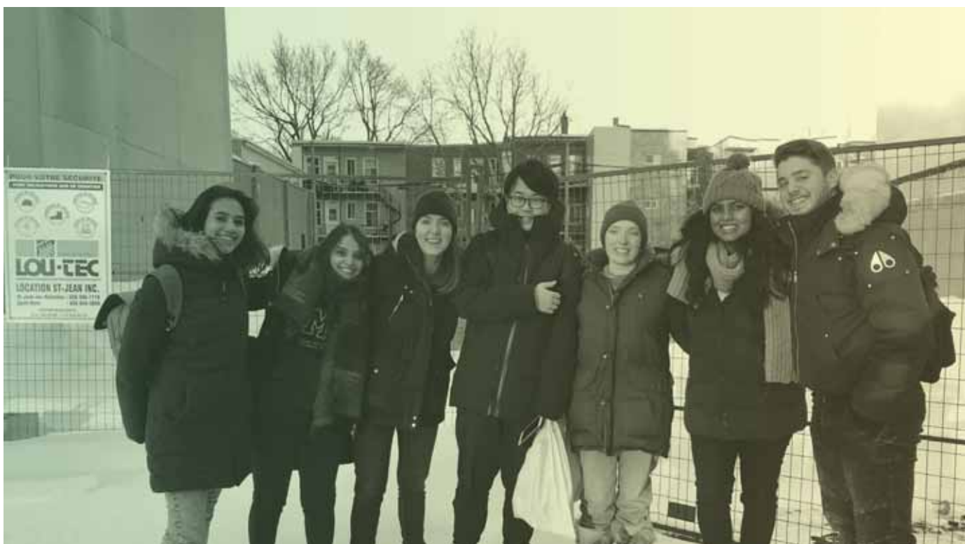
Visite du comité provisoire sur le site du projet