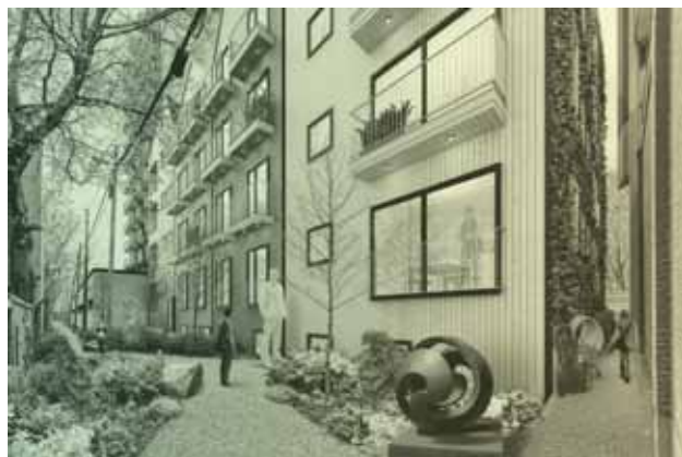
Rendu préliminaire du projet de ruelle verte