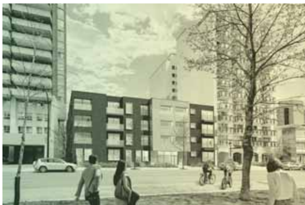
Rendu préliminaire de la façade avant du bâtiment

Du côté du financement, l'année 2017 a commencé en force avec la confirmation d'une contribution de la Ville de Montréal à hauteur de 500 000 $. Cette participation représente la seule subvention octroyée au projet et correspond à environ 4% de son budget total. D'autres financements ont également été confirmés, alors que le Fonds immobilier de solidarité FTQ a offert du financement intérimaire à hauteur de 500 000 $ et que la Fiducie du Chantier de l'économie sociale a porté son prêt de capital patient immobilier de 1,1 à 1,5 millions $. Ces investissements permettront à l'UTILE, au cours de 2018, de décontaminer les sols avant que ne débute le chantier de construction comme tel.